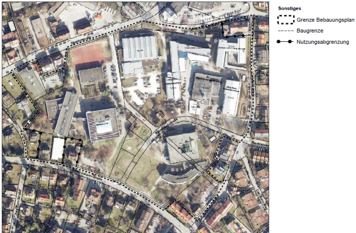
Abbildung 1: Übersicht Plangebiet

Das Plangebiet befindet sich in zentraler Lage nordöstlich der historischen Altstadt der Stadt Überlingen. Mit einer Fläche von rd. 63.800 m 2 umfasst der Geltungsbereich derzeit Schulgebäude mit dazugehörigen Sporteinrichtungen sowie mehreren PKW-Stellplatzflächen. Weitere Bestandteile des Bebauungsplangebietes der 1. Teiländerung sind eine Unterkunft mit „Bed & Breakfast“ im Nordwesten, drei Wohngebäude im Südwesten und ein gewerblich genutztes Gebäude im Nordosten des Areals. Das bestehende Schulzentrum erstreckt sich zwischen der „Obertor-Straße“, der „Untere-St.-Leonhard-Straße“ und der „Sankt-Johann-Straße“. (s. Abb. 1 )