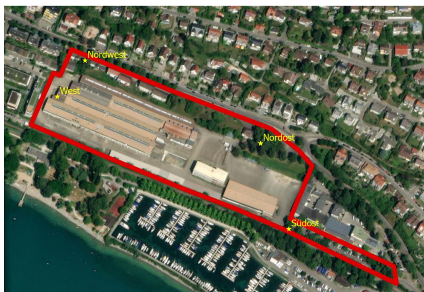
Abbildung 4: Position der Detektoren zum Dauermonitoring