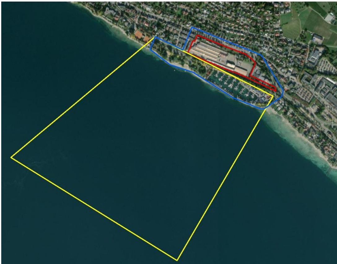
Abbildung 3: Abgrenzung des Vorhabengebiets (rot), des Untersuchungsraums Brutvögel (blau) sowie des Untersuchungsraums Rastvögel (gelb).

Alle Erfassungen wurden vom Artenexperten und Ornithologen Manfred Sindt (Planstatt Senner GmbH) im Jahr 2021 durchgeführt, im Jahr 2022 wurden die Mehlschwalbennester noch einmal kontrolliert. 2024 fand nochmals eine Relevanzbegehung statt, um die Ergebnisse aus dem Jahr 2021 zu validieren und die Mehlschwalbennester zu kontrollieren. Die Untersuchungsräume sind der Abbildung 3 zu entnehmen.