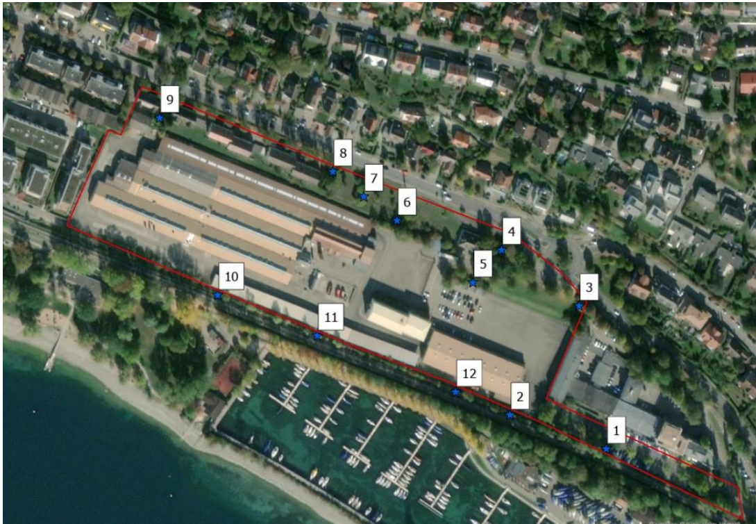
Abbildung 5: Verortung der Haselmaustubes incl. Nummerierung der Tubes