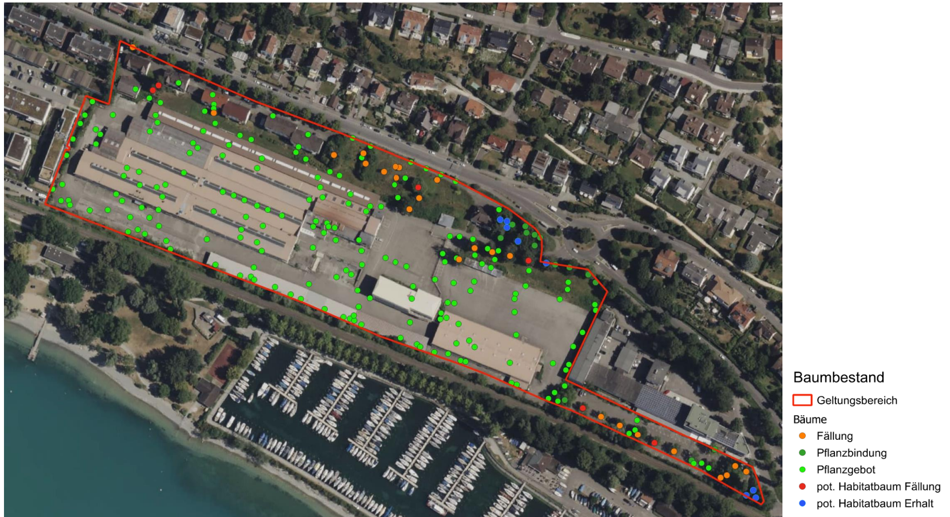
Abbildung 8: Entfallene Bäume und entfallende Habitatbäume sowie Lage der potenziellen Habitatbäume, Karte genordet, Bestandsaufnahme 2024