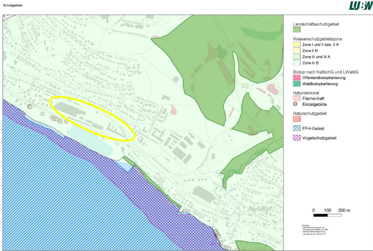
Abbildung 2: Schutzgebietskulisse. Ungefähre Lage des Plangebiets in Gelb (LUBW, 2021).

Das Vorhabengebiet liegt in keinerlei Schutzgebiet (Naturschutz), es befinden sich keine nach § 30 BNatSchG / § 33 NatSchG geschützten Biotope innerhalb des Vorhabengebiets.