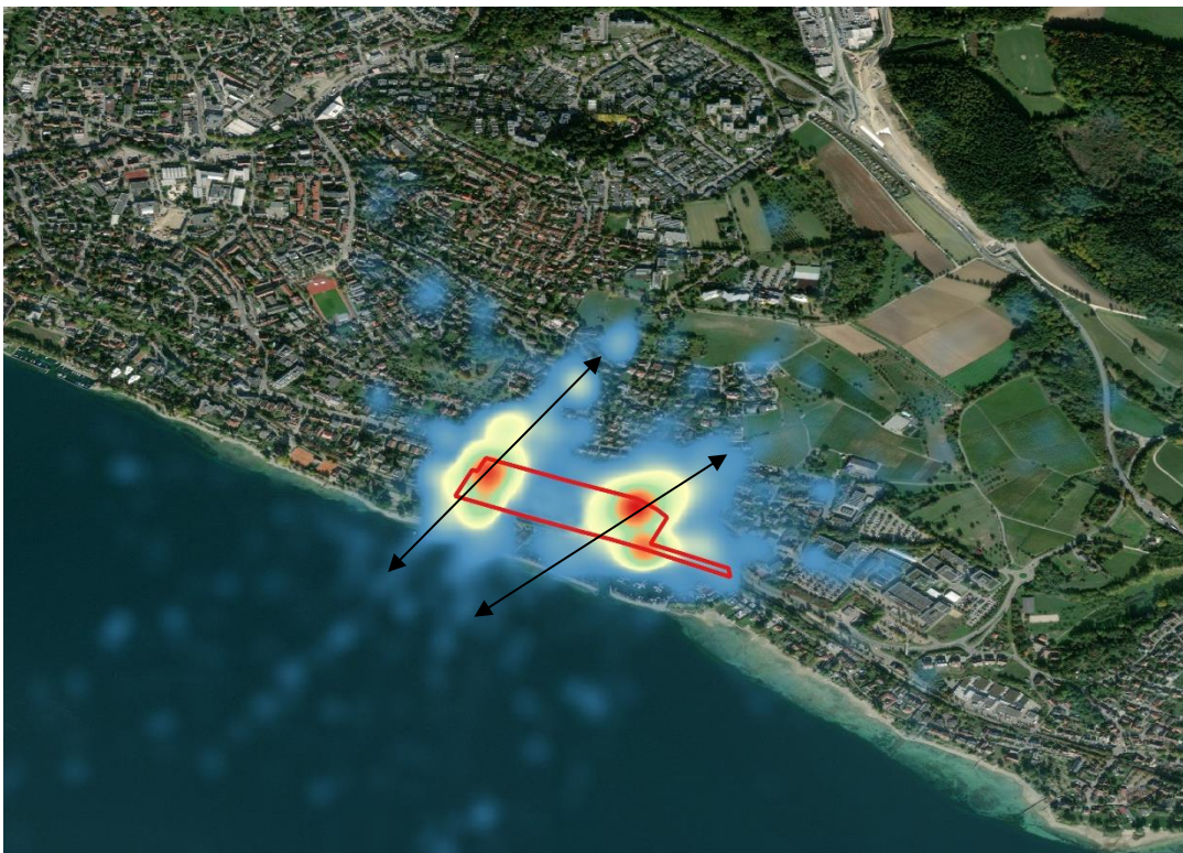
Abbildung 7: Heatmap der Verteilung der Fledermausrufe (Aggregation aller Dauermonitoringsequenzen). Hohe Sequenzabundanz (rot), geringe Sequenzabundanz (blau). Die Pfeile stellen Bereiche mit vielen Überflügen und somit potentiellen Flugrouten von Ruhestätten zu Nahrungsstätten dar. Maßstab 1 zu 2500.