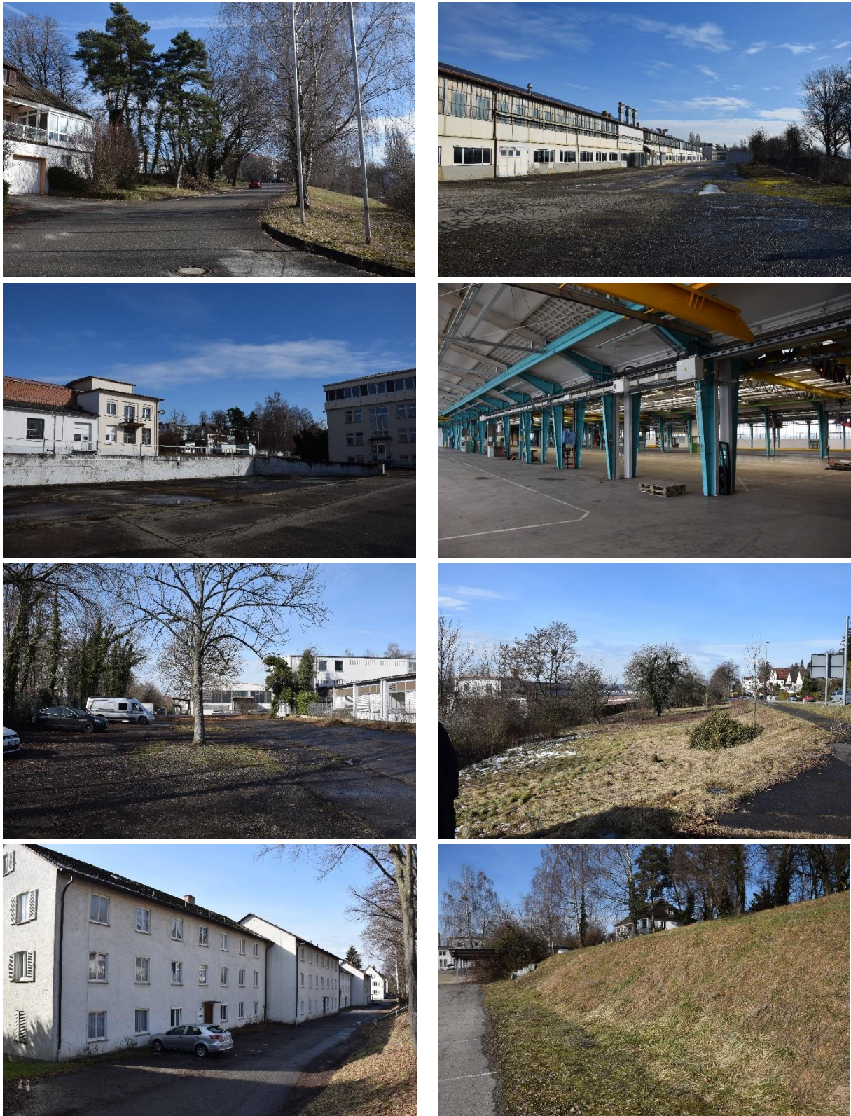
Abbildung 1: Bilder des Vorhabengebiets