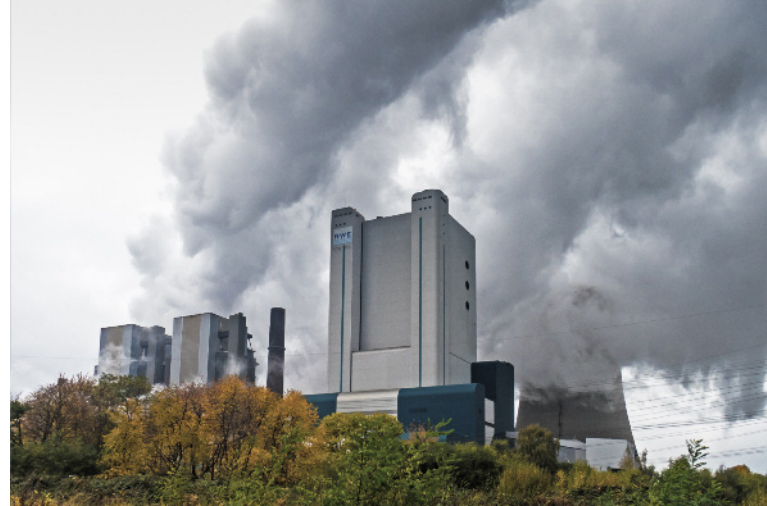
Wählen Sie selbst zwischen Ökostrom aus P oder dem Strom aus z.B. Kohle

Weitere Nachteile fossiler Brennstoffe, die Gesundheit und Lebensraum des Menschen gefährden, verringert der Einsatz von PV ebenfalls. Denken Sie etwa an den enormen Flächenverbrauch durch den Abbau von Braunkohle! Hinzu kommt, dass die