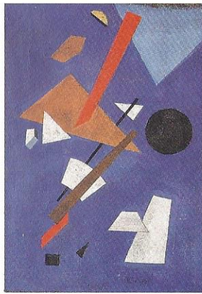
Iwan Puni Suprematistische Komposition, 1915/16 Berlin, Sammlung Kuchinke