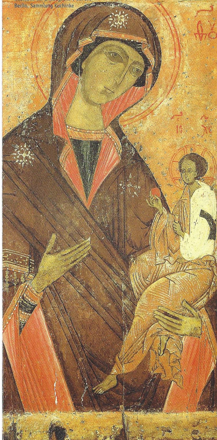
Georgische Muttergottes im Bildtypus der „Hodegetria“, 16. Jh. Berlin, Sammlung Kuchinke