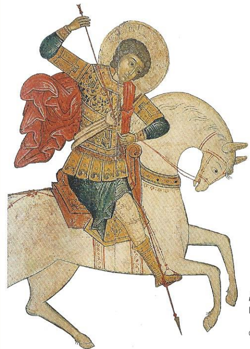
Hl. Georg, Jaroslawe, 17. Jh., Berlin, Sammlung Kuchinke

Erstmals sind im Süden die Höhepunkte der größten Privatsammlung russischer Kunst in Deutschland zu sehen – 95 Werke aus der Sammlung Kuchinke, Berlin. Die Ausstellung in der Städtischen Galerie Überlingen mit Werken aus sieben Jahrhunderten (15. bis 21. Jahrhundert) konfrontiert auf einzigartige Weise die Kunst der russischen Ikone, der klassischen Moderne, der Suprematistischen Avantgarde, der inoffiziellen systemkritischen Kunst und der Gegenwart.