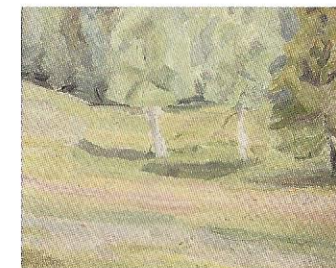
Elena Guro Russische Birken / Impressionistische Komposition, 1904 Berlin, Sammlung Kuchinke

Im Museum und im Münster machen Sie sich mit der christlichen Bilderwelt des Westens vertraut. Darauf aufbauend betrachten Sie in der Städtischen Galerie dann die russischen Ikonen und entdecken dabei Gemeinsamkeiten wie Unterschiede. Abschließend machen Sie einen kurzen Rundgang durch die Ausstellung und betrachten Werke der Avantgarde vom Beginn und aktuelle Kunst- richtungen vom Ende des vergangenen Jahrhunderts. Sa. 28.06., 12.07., 26.07., 09.08., 23.08., 13.09., 27.09., 04.10., 25.10.08, jeweils 15:30–17:00 Uhr Treffpunkt Städtisches Museum, Krummebergstr. 30, Kasse. Teilnahme € 10,00 (inkl. Eintritte. Keine Ermäßigungen)