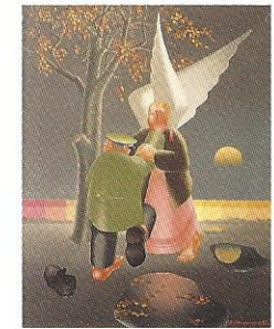
Wladimir Owtshinnikow Ikarus, 1980 Berlin, Sammlung Kuchinke