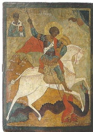
Ikone des hl. Georg, 15. Jh.

Ausstellungskatalog Bildband im Großformat 27 x 24 cm. Michael Imhof Verlag, € 19,95